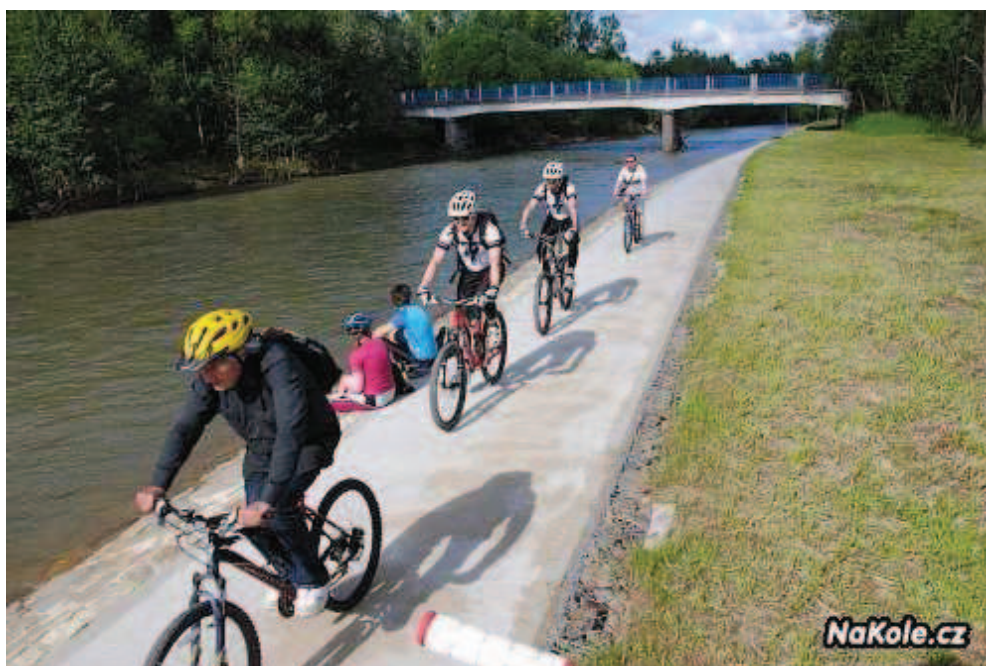
Cyklostezka Bečva před Valašským Meziříčím.

Od pramenů Vsetínské Bečvy až do její soutok s Moravou jsme vyrazili na kolech společně s reportéry Toulavé kamery. S kamerou a stativem na rameně se filmaři vydali po stezce podél řeky. Jak jsme se přesvědčili, cyklostezka Bečva má co nabídnout MTB jezdcům i rodinám s dětmi.