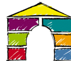
Schéma místní Agendy 21 Procesy a výstupy