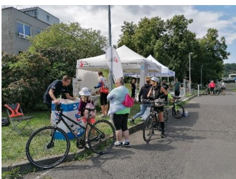
Obr. příloha 3: Bezpečné na kole