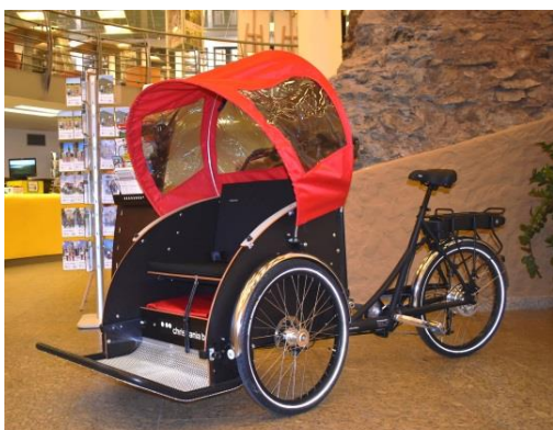
Obr. příloha 7: Elektrotříkolka - Cykloterapie