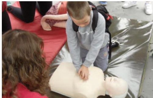
Obr. příloha 2: Dny bez úrazu