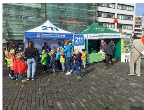
Obr. příloha 4: Den pro zdraví