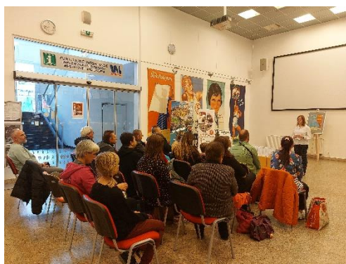
Obr. příloha 6: Veřejná diskuze s občany