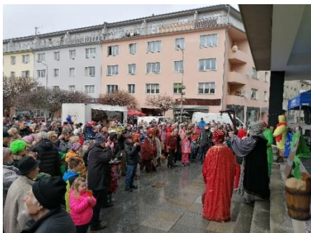
Obr. příloha 1: Ústecký masopust