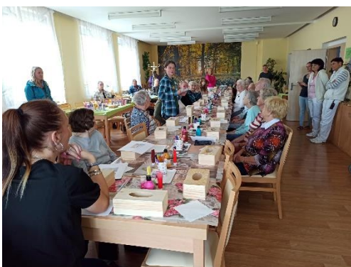
Obr. příloha 5: Oblast sociální politiky města