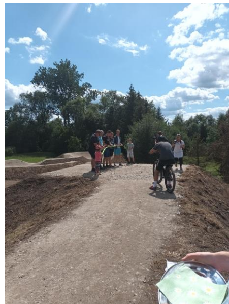
Slavnostní otevření pumtracku Dobříš 10.08.2023.